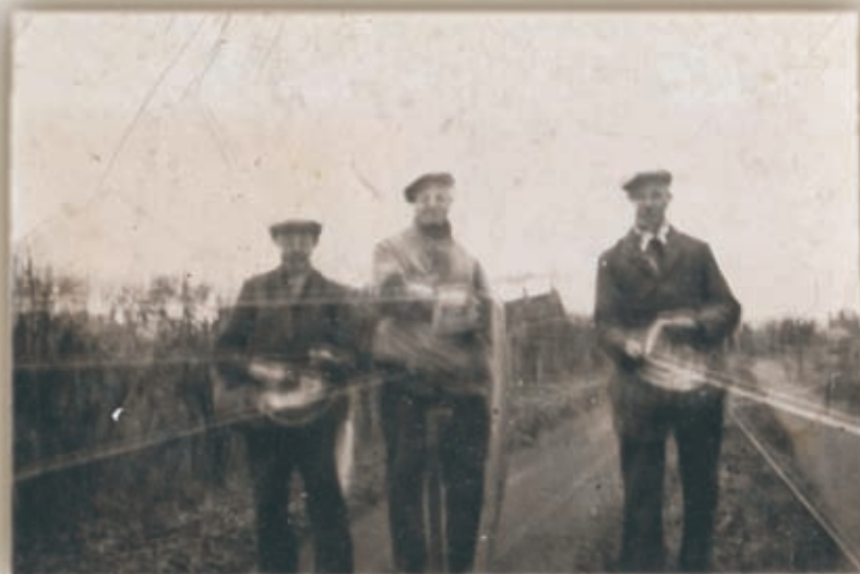
18. Ferme spinners

Afbeelding 17 is het draaijerke, met een schoon gedichtje eronder, ongeletterd, arm maar soms een smeerlap als hij het in zijn botten kreeg.