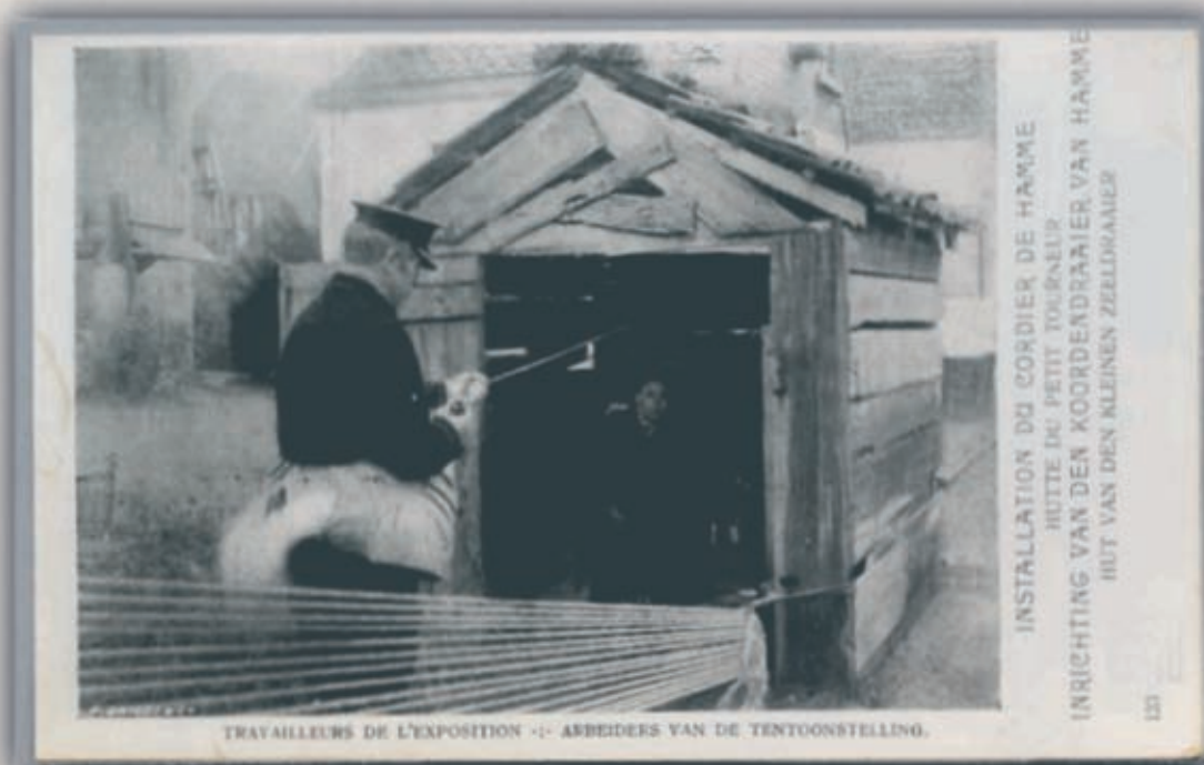
9. Een oud spinhuizeken

Op afbeelding 8 staan de vrouwen van de spinners schoon en proper te nietsen, maar dat was omdat ze getrokken werden. De vrouwen hun plaats was in de keustal, waar de kemp gehegeld werd. Die wijven waren van de "kweekhoek" op de Posthoorn. 't Woord zegt het zelf, er werd evenveel gekweekt als gesponnen. Verder ziet ge in afbeelding 9 hoe een spinhuizeken er uit ziet, wat oude planken, stukken zeildoek of juten emballage, wat