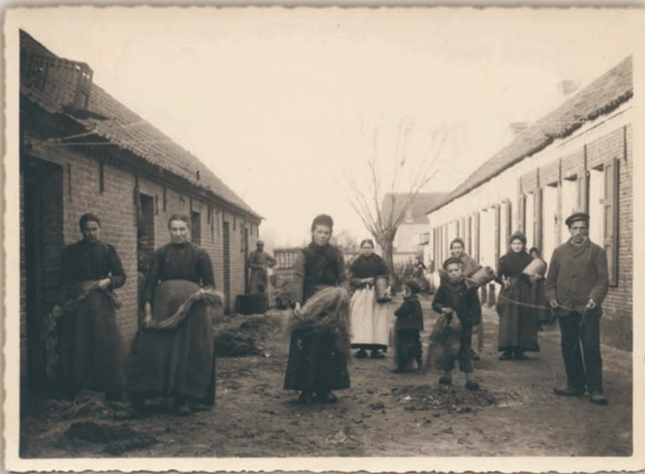
B. Foto van voor 1914

van Hamme" (afbeelding 7). Een zeel is het Hamse woord voor koord. Afgezien van wat onnozelkloterij kon het schrijfsel er nogal door... "Klein, rustig plaatsken", schrijft hij. Hij moest ons eens zien met een stuk in ons kloten als we aan het rechten zijn tegen die van Moes! Den draaijer is hier vervangen door een meeloper, maar dat leg ik later wel uit. Het garen diende niet alleen om pakjes te binden, gelijk hij schrijft. Waar zouden al die pakjes naar toe gegaan zijn? Neen, hoofdzakelijk was het garen bestemd